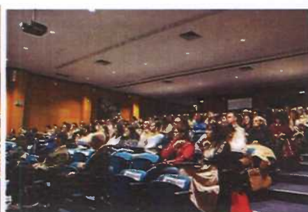
Sessão de promoção de Saúde Mental - Viver com Saúde Mental